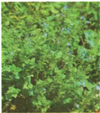
1081. Вероніка дубровна.